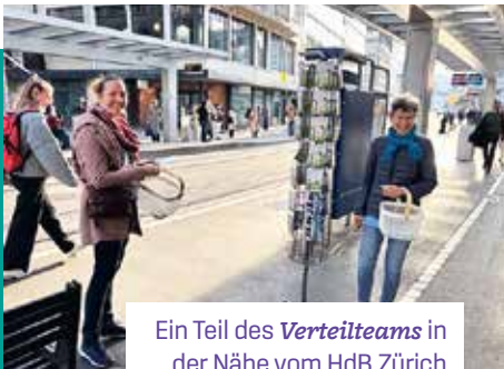
Ein Teil des Verteilteams in der Nähe vom HdB Zürich