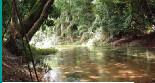
Forêt Classée du Kou (Naturschutzgebiet) in der Region von Guiriko