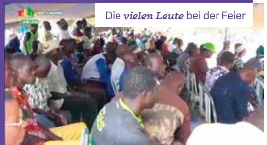
Die vielen Leute bei der Feier