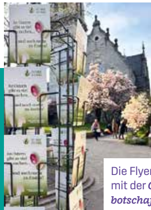
Die Flyer mit der Osterbotschaft