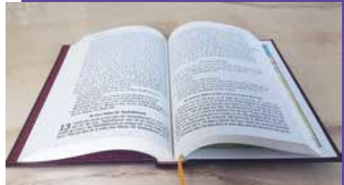
Das Neue Testament auf Bwamu Cwii

Zusammenfassend lässt sich sagen, dass diese Bibelausgabe die Alphabetisierung und die Evangelisierung fördern und ein besseres Verständnis der biblischen Botschaft ermöglichen wird. Auf diese Weise werden Herzen berührt. Und solche Ergebnisse verleihen unserer Mission einen wirklichen Sinn!