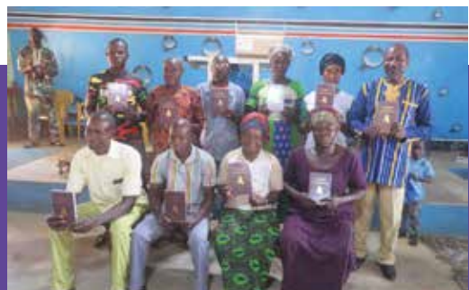
Mitglieder der örtlichen Gemeinde halten glücklich das NT auf Bwamu Cwii in der Hand.