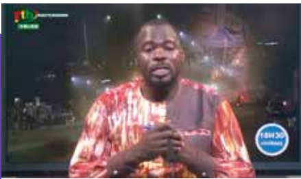
Screenshot des Videos der Fernsehnachrichten , wo die Reportage zu sehen war