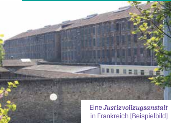
Eine Justizvollzugsanstalt in Frankreich [Beispielbild]